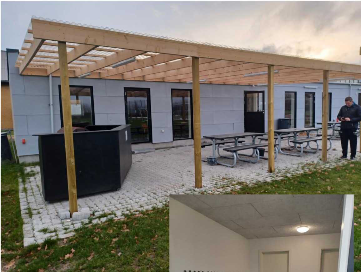
Klubhus med toiletfaciliteter, udeområde etc.